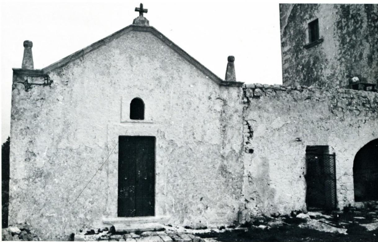
Chiesa della masseria "San Paolo Grande". Esterno.

Sulle pareti laterali in prossimità dell'altare si aprono due nicchie portaoggetti.