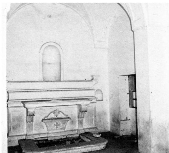
Chiesa della masseria "Grottone". Interno.