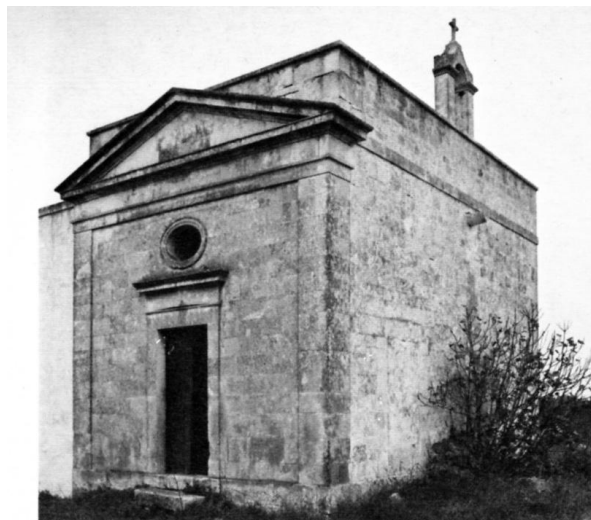
Chiesa della masseria "Grottone". Esterno.

L'interno è costituito da un'unica aula voltata "a Botte" e con pavimentazione originaria "a chianche". Due pilastri che fuoriescono dalle pareti laterali dividono la navata dal presbiterio, che è sopraelevato di un gradino, ed è voltato "a botte unghiata".