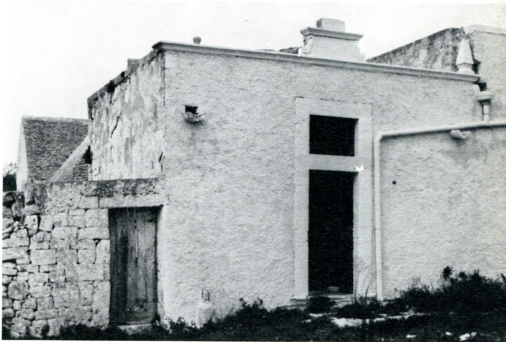
Chiesa della masseria “Grieco”. Esterno.

L'edificio di culto è ubicato sulla strada provinciale Ostuni-Martina Franca. Al Km. 13, dopo aver superato la cappella di “Chiobica” deviare a sinistra per Ceglie M.: due colonne evidenziano un tratturo che porta direttamente alla masseria.