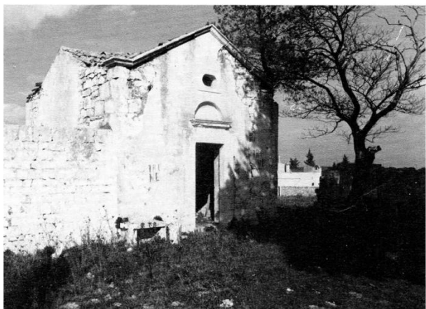
Chiesa "Camillo Tanzarella". Esterno.

La chiesa, ora abbandonata, necessiterebbe di un immediato restauro per un ripristino a luogo di culto.