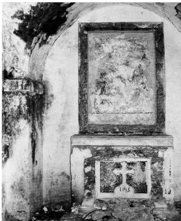
Chiesa "Camillo Tanzarella". Interno.