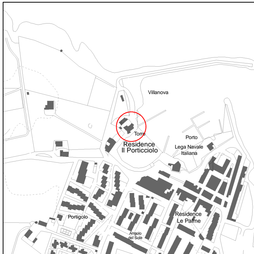
Individuazione del bene su carta tecnica regionale (scala 1:5.000)