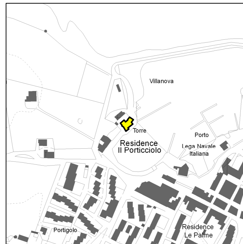
Individuazione del bene su aerofotogrammetria (scala 1:4.000)

□ limiti comunali □ Localizzazione del bene