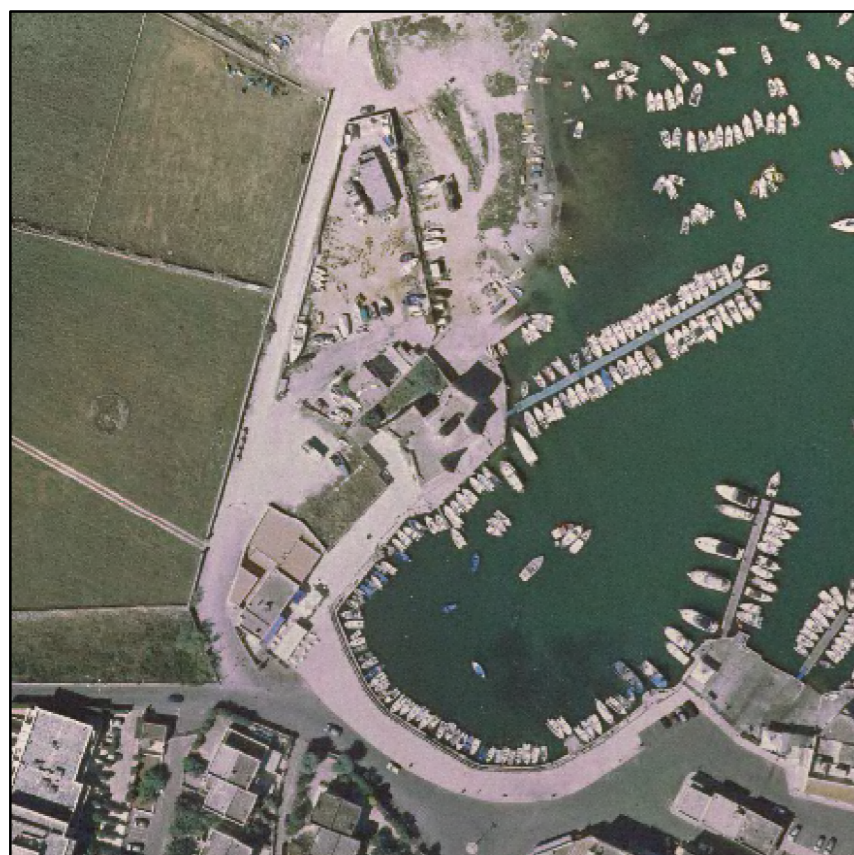
Individuazione del bene su ortofotocarta regionale (scala 1:2.000)