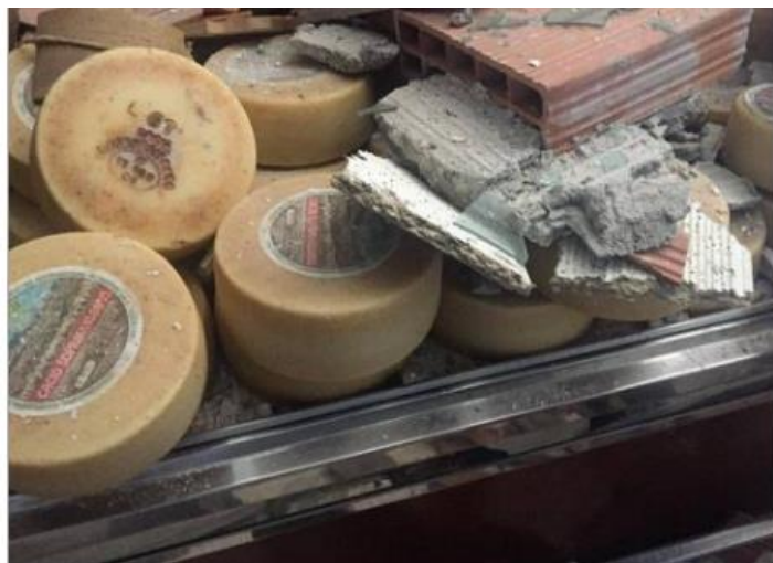
Caciotte dell'azienda Scolastici sotto le macerie

http://www.cronachemaceratesi.it/2016/11/04/caciotte-tra-le-macerie-lazienda-scolastici-va-avanti/882676/