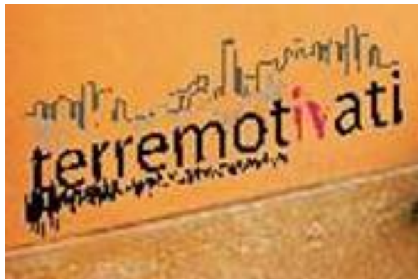
Il muro presso la "Taverna del Ponte" a Visso

MARCHE SMART CITY legge i contenuti dei Siti web e delle pagine Facebook e riporta le informazioni utili per fotografare le conseguenze del sisma e per seguire quotidianamente la rinascita.